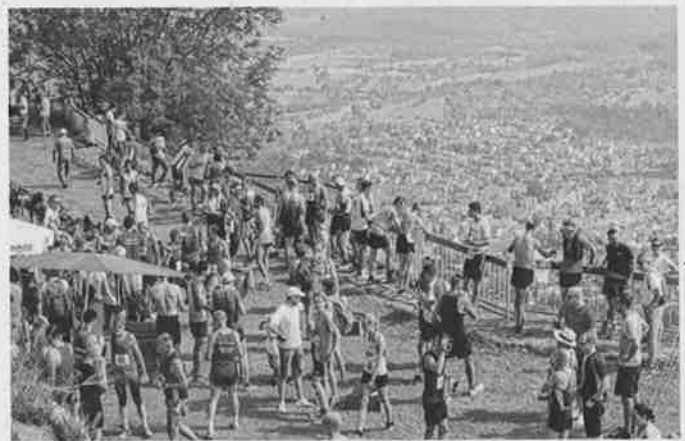
Zielverpflegung mit Aussicht