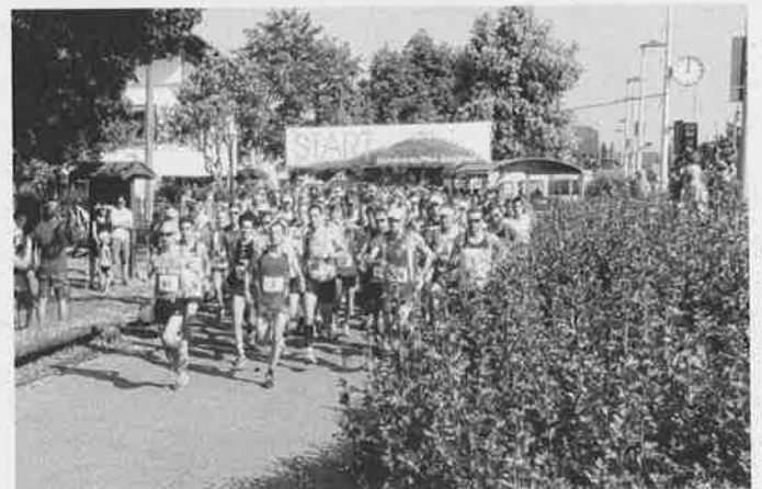
Start zum 30. Hohenneuffen-Berglauf

Organisationsteam Hohenneuffen-Berglauf (TSV Beuren und TSV Frickenhausen)