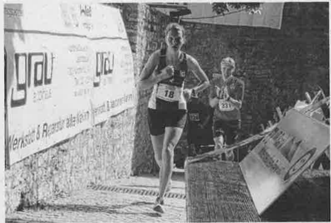
Zieleinlauf im Burghof

Weitere Bilder vom Hohenneuffen-Berglauf: