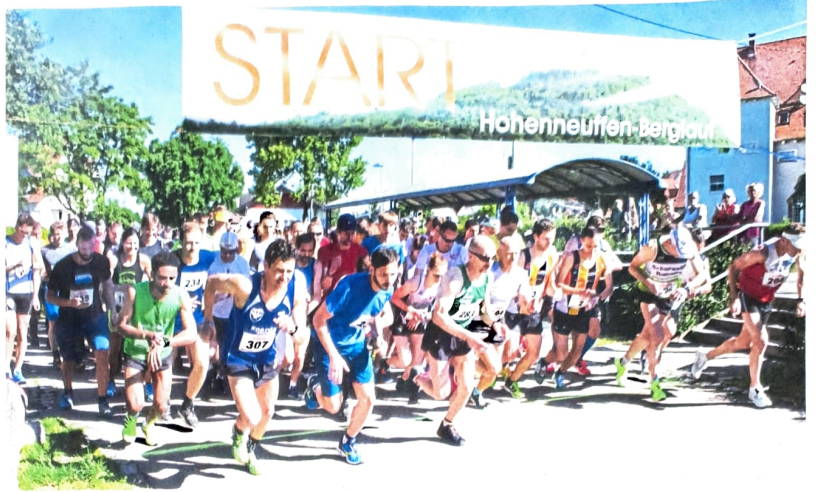
Am morgigen Sonntag um 9 Uhr erfolgt in Linsenhofen der Startschuss zum 33. Hohenneuffen-Berglauf. Ebenfalls findet auf gleicher Strecke zum 15. Mal eine Walking-/Nordic-Walking-Wertung statt.