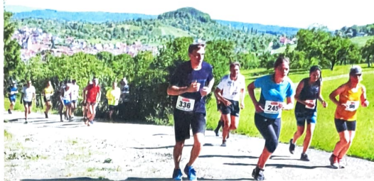
Anstieg an der Bleiche oberhalb von Beuren.

Der Hohenneuffen-Berglauf eignet sich besonders für Berglaufeinsteiger, so die Organisatoren, denn die Strecke bietet unterwegs einige erholsame Flach- und Bergabpassagen. Aber auch für Bergspezialisten ist die Strecke ein Prüfstein, denn sie verlangt ständige Rhythmuswechsel. Der große Reiz dabei ist, für sich selbst die optimale Renneinteilung zu finden. Insgesamt gesehen ist die Strecke (für einen Berglauf) eher „schnell“. Zudem bietet sich durch die Flachpassagen die Möglichkeit, neben aller Anstrengung auch die landschaftlichen Reize zu genießen – von denen es viele am Rande der Schwäbischen Alb gibt. Im ersten Teil der Strecke wird auf asphaltierten oder fein geschotterten Wegen gelaufen, ab der Skihütte (Kilometer 4,5) führt die Strecke auf Waldwegen bis hinauf in den Burghof des Hohenneuffen. Die Streckenlänge beträgt 9,3 Kilometer mit circa +535/-180 Höhenmetern. pm