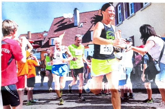
Auf dem Streckenabschnitt durch Balzholz