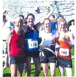
Impression von 2019: Glücklich im Ziel!