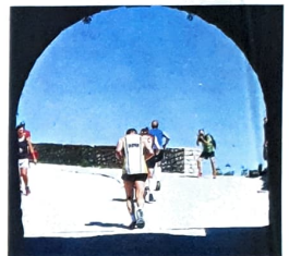
Licht am Ende des Tunnels

Bei der anschließenden Burgumrundung gibt es die letzte Gelegenheit zur Erholung, denn zum Abschluss des Rennens kommt die gefürchtete, aber auch beeindruckende Schlusssteigung Richtung Burghof. Dort oben erwartet die Läufer dann neben der Zielverpflegung ein grandioser Blick auf die Kaiserberge, die Teck, die Fildern und das Neckartal. pm